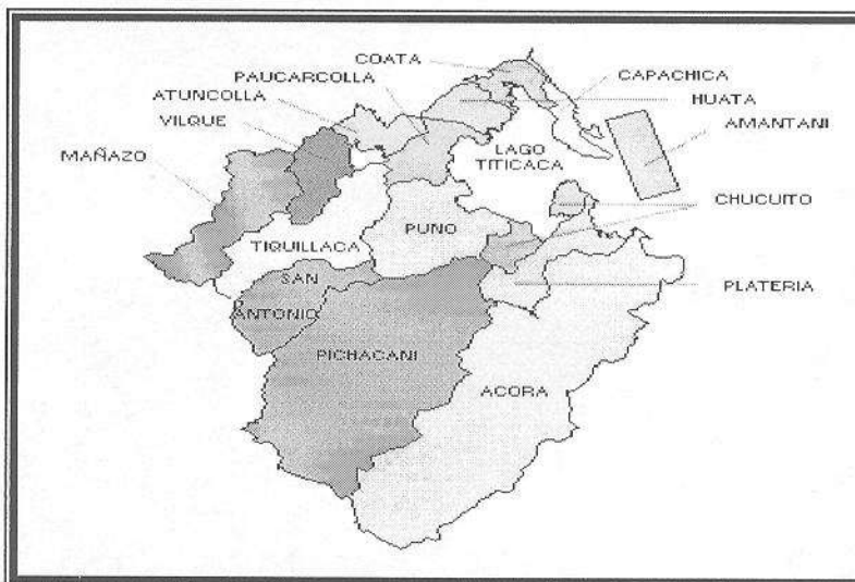
FIGURA Nº 02: ZONA DE INFLUENCIA

La Provincia de Puno representa el 9.7% de la superficie de la Región y alberga el 17.9% de la población regional; mientras que el Distrito de Puno representa el 7% de la superficie de la provincia y alberga al 55.6% de la población provincial.